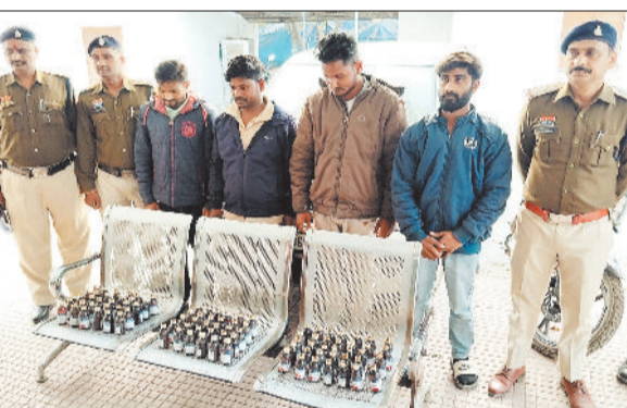
जब नशीली सीरप के साथ पुलिस गिरफ्त में आरोपी।