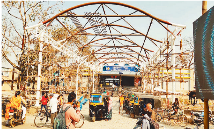
जांजगीर-चांपा। जिला मुख्यालय जांजगीर नैला के मॉडल रेलवे स्टेशन का इन दिनों कार्यालय के तहत शेड का निर्माण कार्य कराया जा रहा है। इससे आने जाने वाले रेल यात्रियों को छाया मिलेगी।