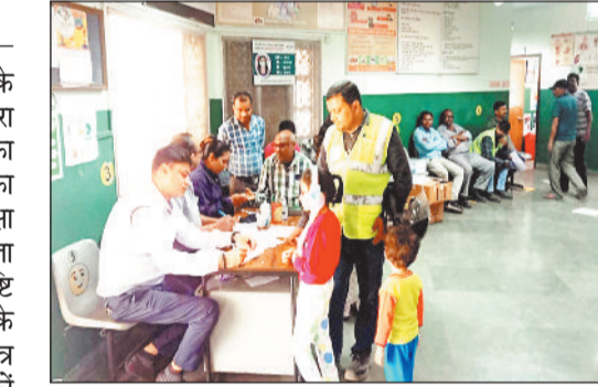
शिविर में जांच करते चिकित्सक।